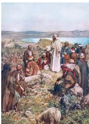
Jesus teaching crowds on a high plain by William Hole

Khi ấy, Chúa Giêsu phán cùng các môn đệ rằng: "Nếu các con không công chính hơn các luật sĩ và biệt phái, thì các con chẳng được vào Nước Trời đâu. Các con đã nghe dạy người xưa rằng: Không được giết người. Ai giết người, sẽ bị luận phạt nơi toà án. Còn Ta, Ta bảo các con: Bất cứ ai phẫn nộ với anh em mình, thì sẽ bị toà án luận phạt. Ai bảo anh em là "ngốc", thì bị phạt trước công nghị. Ai rửa anh em là "khùng", thì sẽ bị vạ lửa địa ngục. Nếu con đang dâng của lễ nơi bàn thờ mà sức nhớ người anh em đang có điều bất bình với con, thì con hãy để của lễ lại trước bàn thờ, đi làm hoà với người anh em con trước đã, rồi hãy trở lại dâng của lễ. Hãy liệu làm hoà với kẻ thù ngay lúc còn đi dọc đường với nó, kẻo kẻ thù sẽ đưa con ra trước mặt quan toà, quan toà lại trao con cho tên lính canh và con sẽ bị tống ngục. Ta bảo thật cho con biết: Con sẽ không thoát khỏi nơi ấy cho đến khi trả hết đồng bạc cuối cùng!"