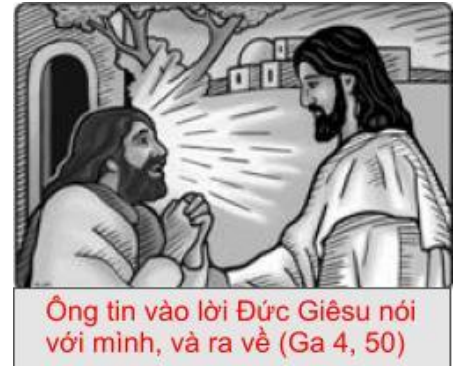
Ông tin vào lời Đức Giêsu nói với mình, và ra về (Ga 4, 50)

Những người đồng hương của Chúa chối bỏ và khinh bỉ Chúa, nhưng viên sĩ quan người lương dân đã tin vào Chúa. Chúa chờ ta đón nhận Chúa.