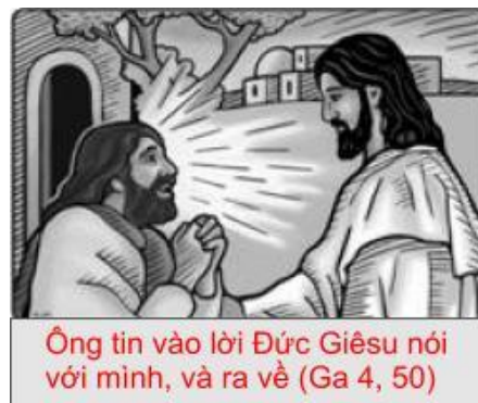
Ông tin vào lời Đức Giêsu nói với mình, và ra về (Ga 4, 50)

Người trở lại Cana xứ Galilêa, nơi đã biến nước thành rượu. Bấy giờ có một chức nhà vua ở Capharnaum có người đang đau liệt. Được tin Chúa Giêsu đã bỏ đến Galilêa, ông đến tìm Người và xin xuống chữa con ông sắp chết. Chúa Giêsu bảo ông: "Nếu các ông không thấy những phép lạ và những việc phi thường, hẳn các ông sẽ không tin". Viên quan chức trình lại Người: "Thưa Ngài, xin Ngài xuống trước khi con tôi chết". Chúa Giêsu bảo ông: "Ông hãy về đi, con ông mạnh rồi". Ông tin lời Chúa Giêsu nói và trở về.