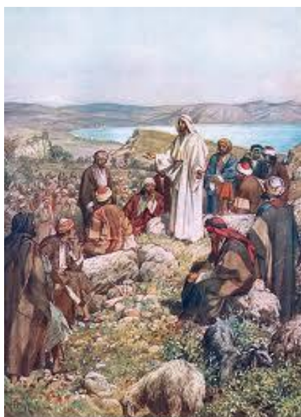
Jesus teaching crowds on a high plain by William Hole

Khi ấy, Chúa Giêsu phán cùng các môn đệ rằng: "Nếu các con không công chính hơn các luật sĩ và biệt phái, thì các con chẳng được vào Nước Trời đâu. Các con đã nghe dạy người xưa rằng: Không được giết người. Ai giết người, sẽ bị luận phạt nơi tòa án. Còn Ta, Ta bảo các con: Bất cứ ai phần nộ với anh em mình, thì sẽ bị tòa án luận phạt. Ai bảo anh em là "ngốc", thì bị phạt trước công nghị. Ai rửa anh em là "khùng", thì sẽ bị vạ lửa địa ngục. Nếu con đang dâng của lễ nơi bàn thờ mà sức nhớ người anh em đang có điều bất bình với con, thì con hãy để của lễ lại trước bàn thờ, đi làm hoà với người anh em con trước đã, rồi hãy trở lại dâng của lễ. Hãy liệu làm hoà với kẻ thù ngay lúc còn đi dọc đường với nó, kẻo kẻ thù sẽ đưa con ra trước mặt quan tòa, quan tòa lại trao con cho tên lính canh và con sẽ bị tống ngục. Ta bảo thật cho con biết: Con sẽ không thoát khỏi nơi ấy cho đến khi trả hết đồng bạc cuối cùng!"