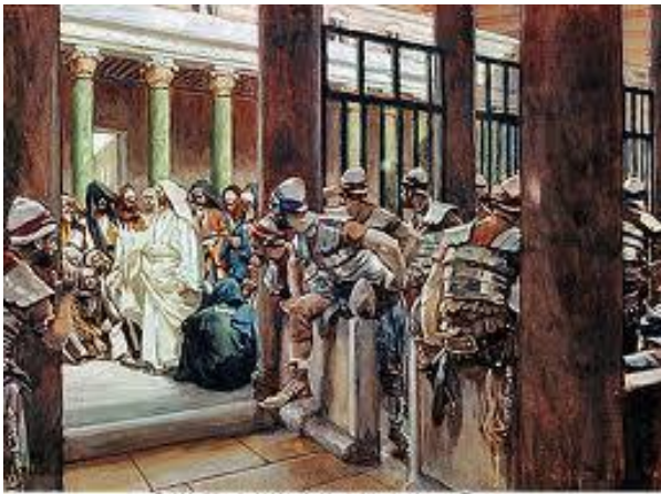
But No Man Laid Hands Upon Him by James Tissot

Khi ấy, Chúa Giêsu đi lại trong xứ Galilêa; Người không muốn đi lại trong xứ Giuđêa, vì người Do-thái đang tìm giết Người. Lúc đó gần đến lễ Trại của người Do-thái. Nhưng khi anh em của Người lên dự lễ rồi, thì Người cũng đi, nhưng không đi cách công khai, mà lại đi cách kín đáo.