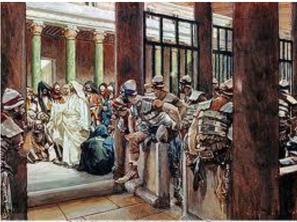
But No Man Laid Hands Upon Him by James Tissot

Khi ấy, Chúa Giêsu đi lại trong xứ Galilêa; Người không muốn đi lại trong xứ Giuđêa, vì người Do-thái đang tìm giết Người. Lúc đó gần đến lễ Trại của người Do-thái. Nhưng khi anh em của Người lên dự lễ rồi, thì Người cũng đi, nhưng không đi cách công khai, mà lại đi cách kín đáo.