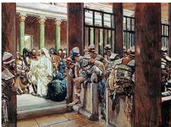
But No Man Laid Hands Upon Him by James Tissot

Khi ấy, Chúa Giêsu đi lại trong xứ Galilêa; Người không muốn đi lại trong xứ Giuđêa, vì người Do-thái đang tìm giết Người. Lúc đó gần đến lễ Trại của người Do-thái. Nhưng khi anh em của Người lên dự lễ rồi, thì Người cũng đi, nhưng không đi cách công khai, mà lại đi cách kín đáo.