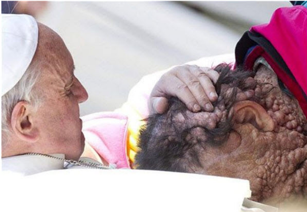
Đức Phanxicô ôm hôn và cầu nguyện cho người đàn ông bị u sởi thần kinh, khiến giáo dân thế giới rung động.