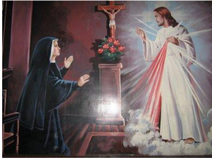
Mỗi lần Chúa hiện ra cùng thánh nữ Chúa đều tỏ ra ý Người