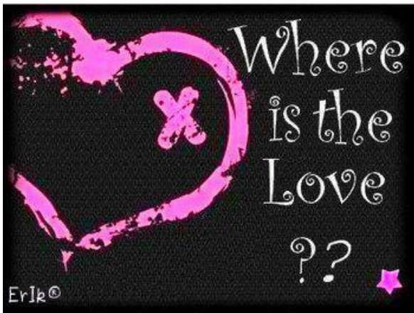
Đố bạn tình yêu là gì?

Phải chăng chính vì cái khái niệm mơ hồ đó làm cho nó trở nên hấp dẫn, và trở nên nguồn cảm hứng cho không biết bao tác phẩm thơ văn, nhạc kịch, điện ảnh..., và cũng do đó trở