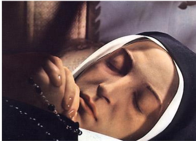
Hình chụp ngày 6/6/1997 sau khi thánh nữ qua đời được 59 năm

ROMA - Thánh Faustina Kowalska có thể sẽ là vị "Tiến sĩ Giáo Hội" đầu tiên của thiên niên kỷ thứ ba: quả thể, các Hồng y và Giám mục qui tụ tại Krakow-Lagiewniki, để tham dự Đại hội Thế giới Lòng Chúa Thương Xót lần thứ hai, đã gửi đến ĐTC Biển Đức XVI một lá thư xin mở hồ sơ tấn phong Tiến sĩ Giáo hội cho nữ thánh.